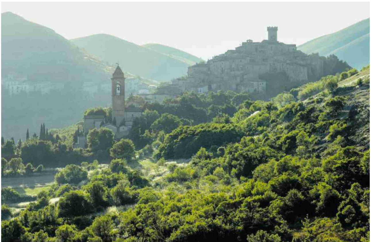
Das «Sextantio» ist überall über Santo Stefano di Sessanio verteilt – in Italien gibt es zwischen 150 und 250 solcher Gaststätten.