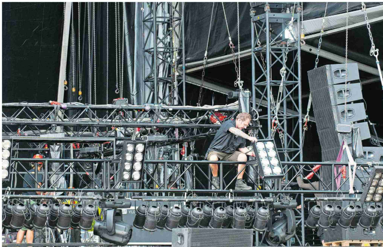
Wegen abgesagter Konzerte und Festivals als Schutz vor dem Coronavirus bleiben für Ton- und Lichttechniker die Aufträge aus.