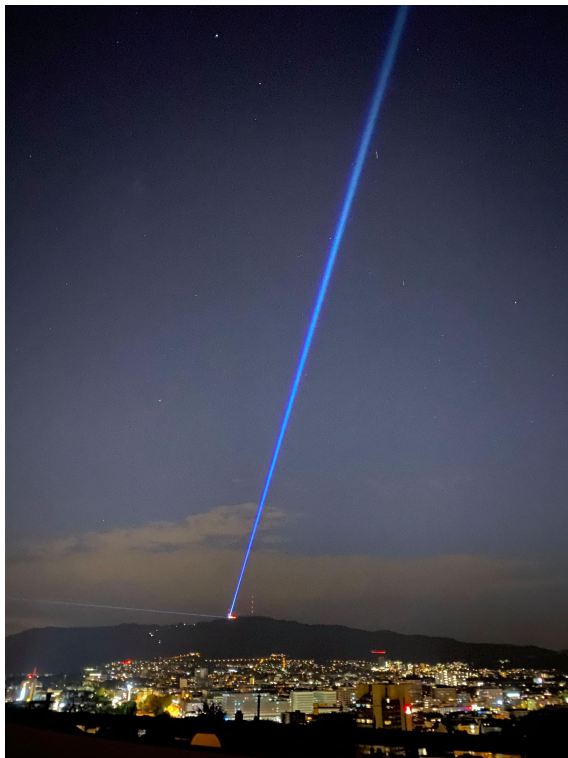
Gebäude, in denen sich vor dem 16. März noch Menschen zu Konzerten, Theateraufführungen und anderen Veranstaltungen getroffen haben, leuchten Rot: Der Zürcher Uetliberg. (22. Juni 2020)