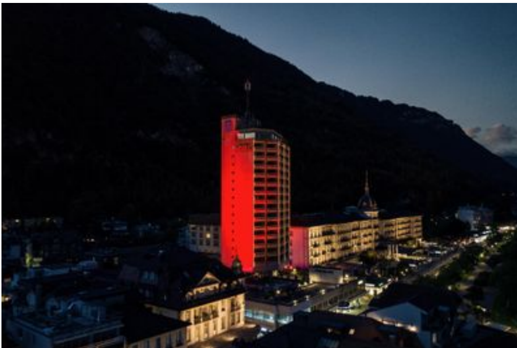
Hotel Metropole, Interlaken.Leser-Reporter