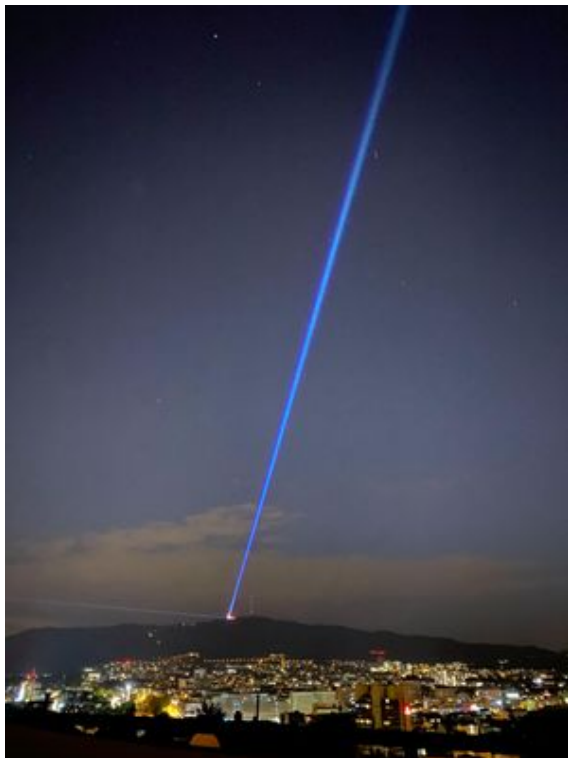
Gebäude, in denen sich vor dem 16. März noch Menschen zu Konzerten, Theateraufführungen und anderen Veranstaltungen getroffen haben, leuchten Rot: Der Zürcher Uetliberg. (22. Juni 2020)