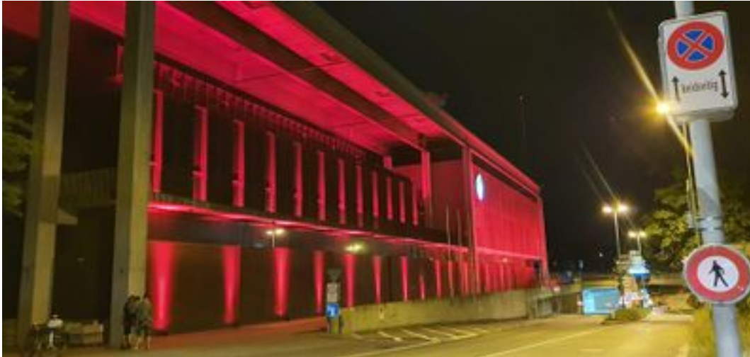
Autobahneinfahrt St. Fiden, St. Gallen.

Referenz: 77581973 Ausschnitt Seite: 4/8