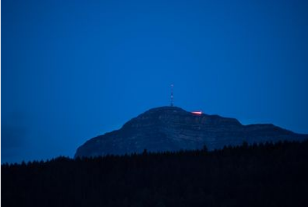
Hotel Rigi Kulm.Leser-Reporter

Referenz: 77581973 Ausschnitt Seite: 8/8