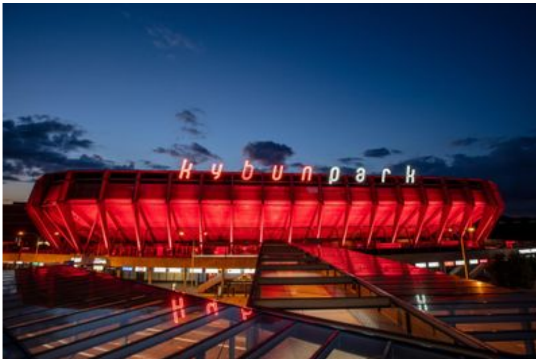
Kybunpark, St. Gallen. Leser-Reporter