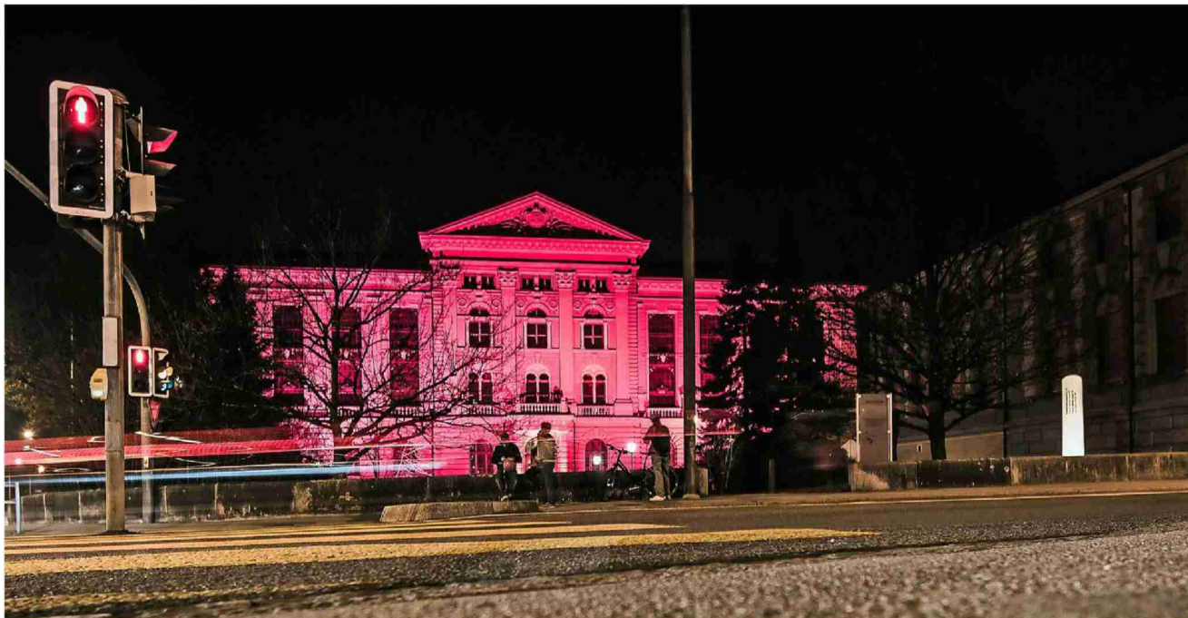
Häuser, Kirchen, Schulen, Kulturstätten, Museen im ganzen Land werden rot beleuchtet – als Zeichen der Solidarität.

Kulturbranche in der Krise Die coronabebutelte Veranstaltungs- und Kulturbranche macht mit einer Lichtaktion auf ihre prekäre Lage aufmerksam.