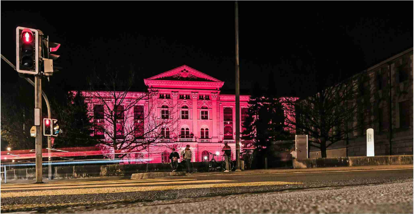
Häuser, Kirchen, Schulen, Kulturstätten, Museen im ganzen Land werden rot beleuchtet – als Zeichen der Solidarität.

Kulturbranche in der Krise Die coronabebutelte Veranstaltungs- und Kulturbranche macht mit einer Lichtaktion auf ihre prekäre Lage aufmerksam.