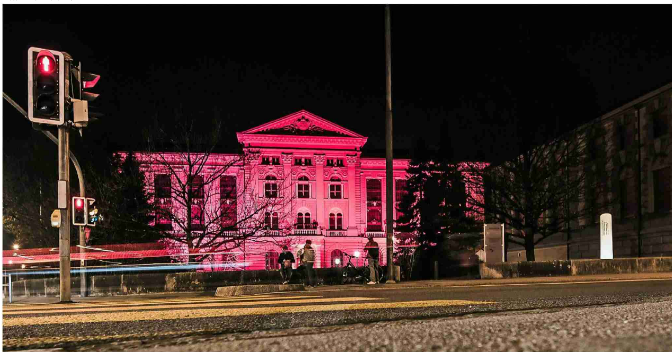
Häuser, Kirchen, Schulen, Kulturstätten, Museen im ganzen Land werden rot beleuchtet – als Zeichen der Solidarität.

Kulturbranche in der Krise Die coronabebutelte Veranstaltungs- und Kulturbranche macht mit einer Lichtaktion auf ihre prekäre Lage aufmerksam.