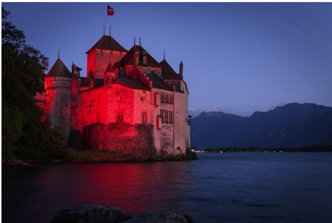
Le château de Chillon a été éclairé en rouge lundi soir.

Lancée en Allemagne, où plus de 5000 sites se sont éclairés lundi soir, la «Night of Light» a fait des émules en Autriche et en Suisse.