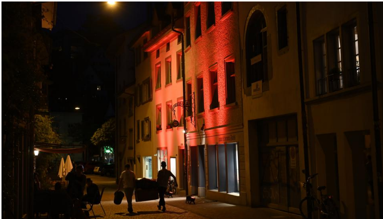
In der ganzen Stadt verteilt, wurden die Gebäude in rotes Licht getaucht.

Referenz: 77585220 Ausschnitt Seite: 4/4