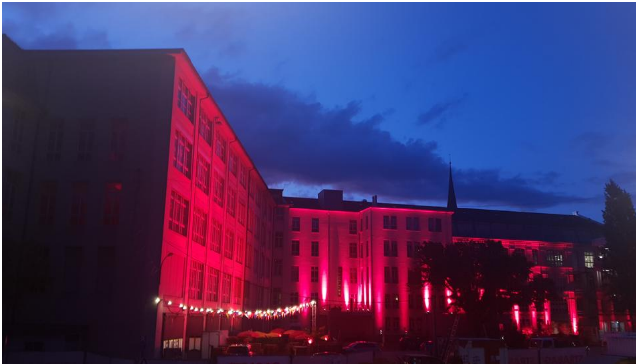
Auch die Eventhalle «Flügelwest» und die Kammgarn wurden rot beleuchtet.

Referenz: 77585220 Ausschnitt Seite: 3/4