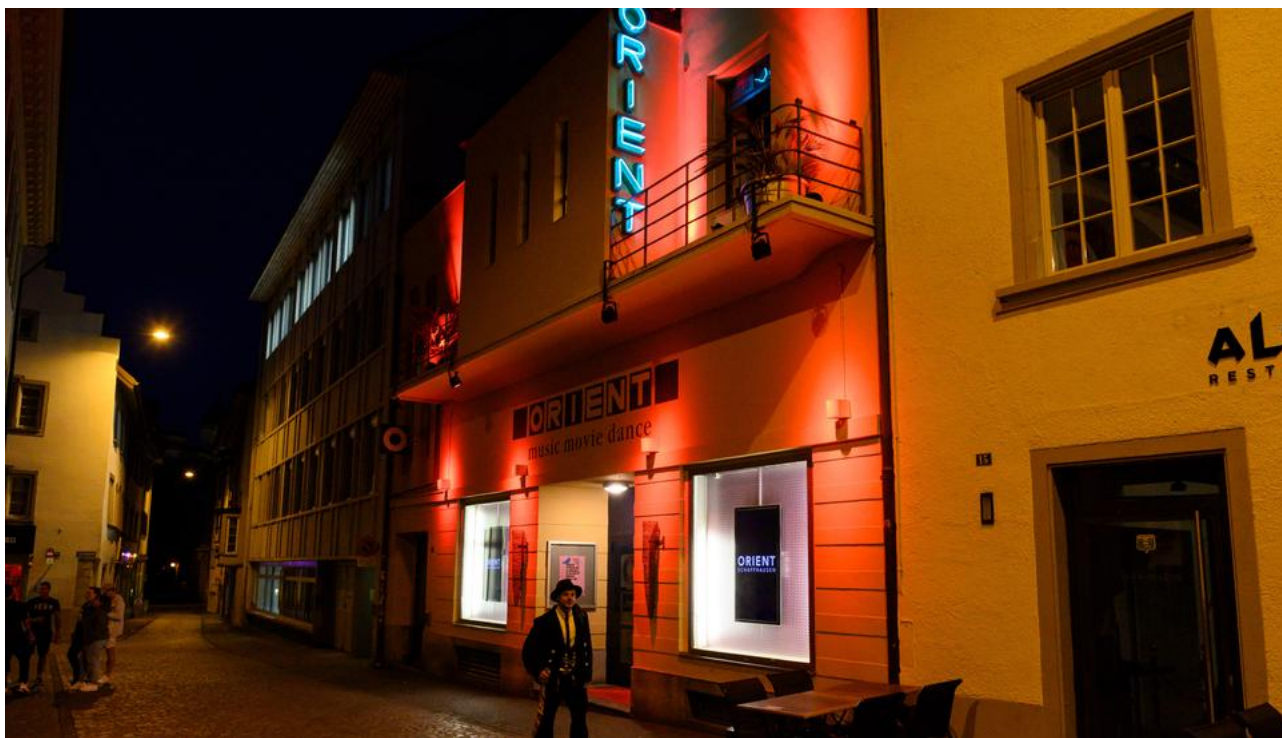
Verschiedene Clubs und Bars - so auch das Orient - wurden für zwei Stunden beleuchtet.