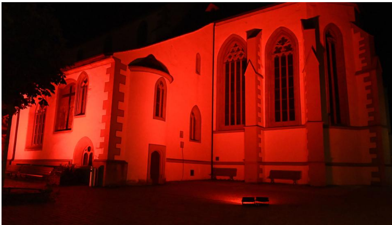
Auch die Kirche St. Johann erstrahlte am Montagabend in rot.