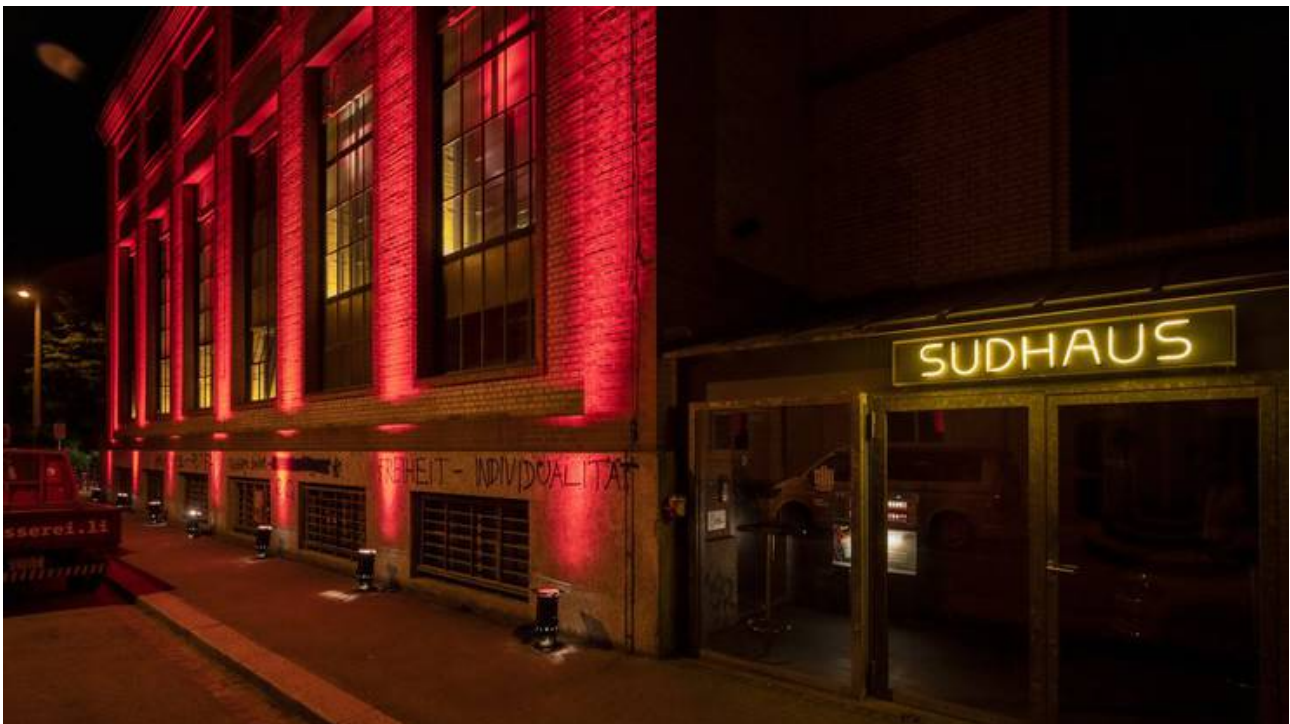
Auch das Sudhaus war Teil der Lichteraktion.facebooktwittermailprintwhatsappshare