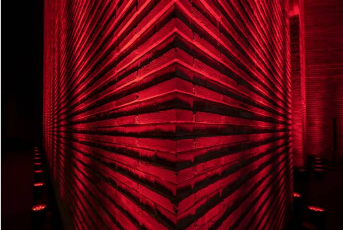
Auch das Kunstmuseum machte bei der Aktion mit. facebook twitter mail print whatsapp share

Referenz: 77585225 Ausschnitt Seite: 4/5