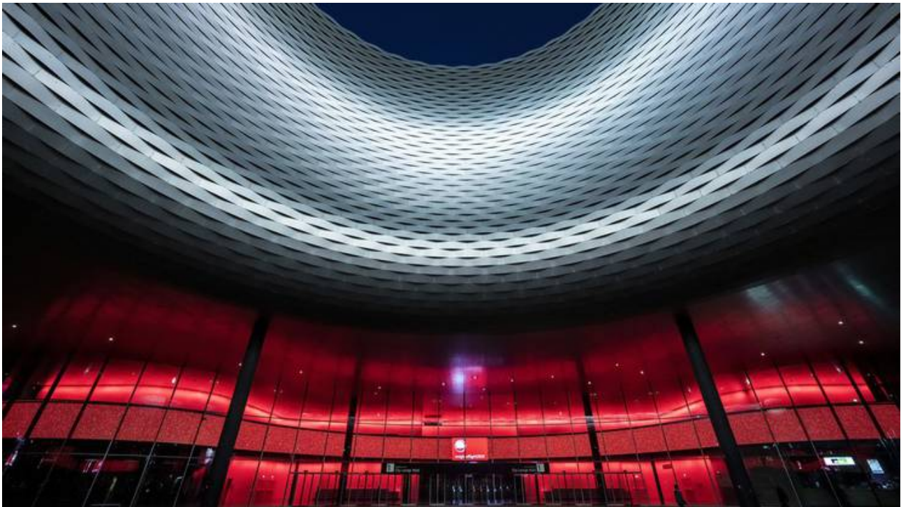
Der Messebau erstrahlte imposant in Rot.facebooktwittermailprintwhatsappshare

Mit der internationalen Aktion, die auch gleichzeitig in Deutschland, Österreich und Belgien stattfand, wollte die Eventbranche auf ihre schwierige Situation aufmerksam machen. Bereits Wochen vor dem Lockdown litt die Veranstaltungstechnikbranche stark unter abgesagten Events.