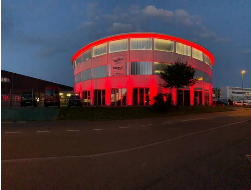
Das Pantheon in Muttenz.

Referenz: 77585227 Ausschnitt Seite: 3/5