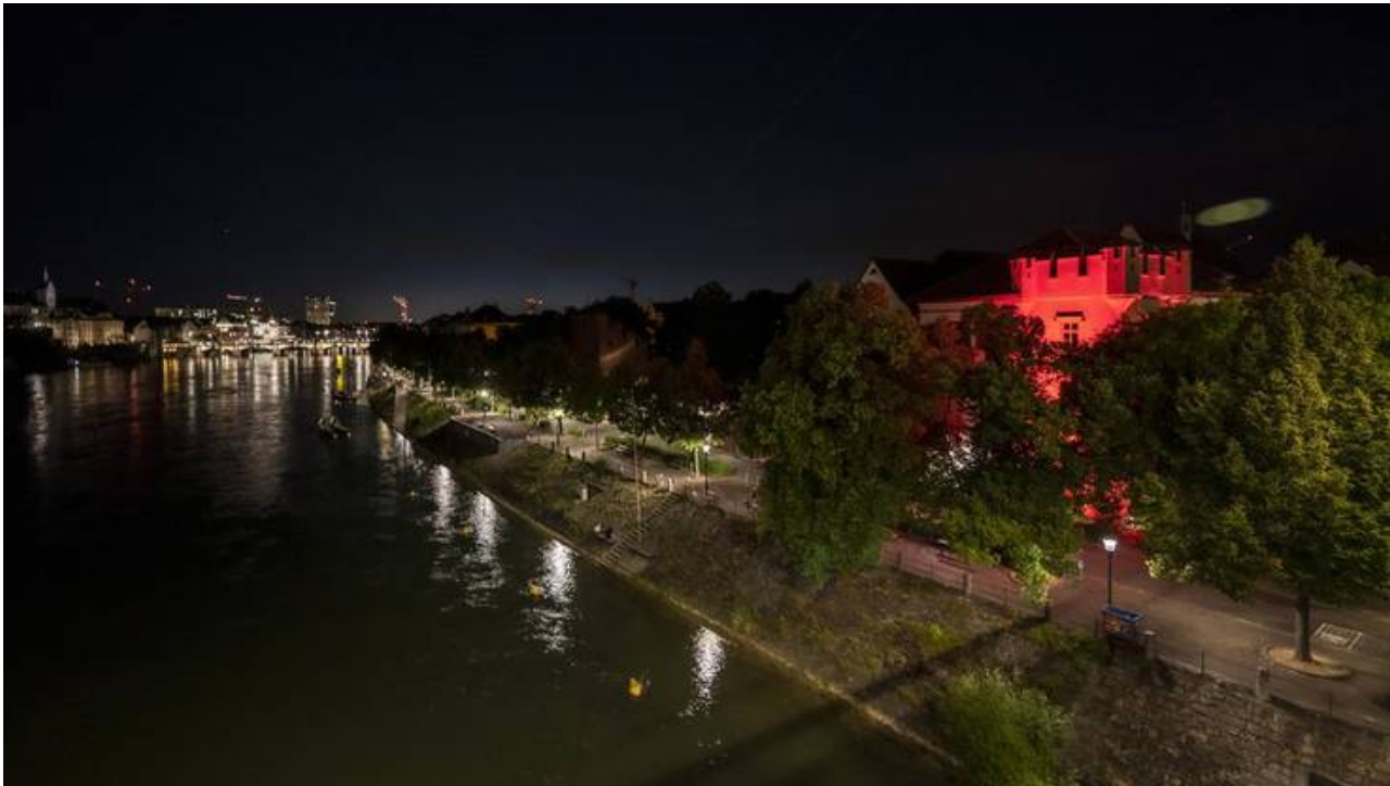
Der Turm des Waisenhauses wurde im Rahmen der Aktion Night of Light rot beleuchtet.facebooktwittermailprintwhatsappshare