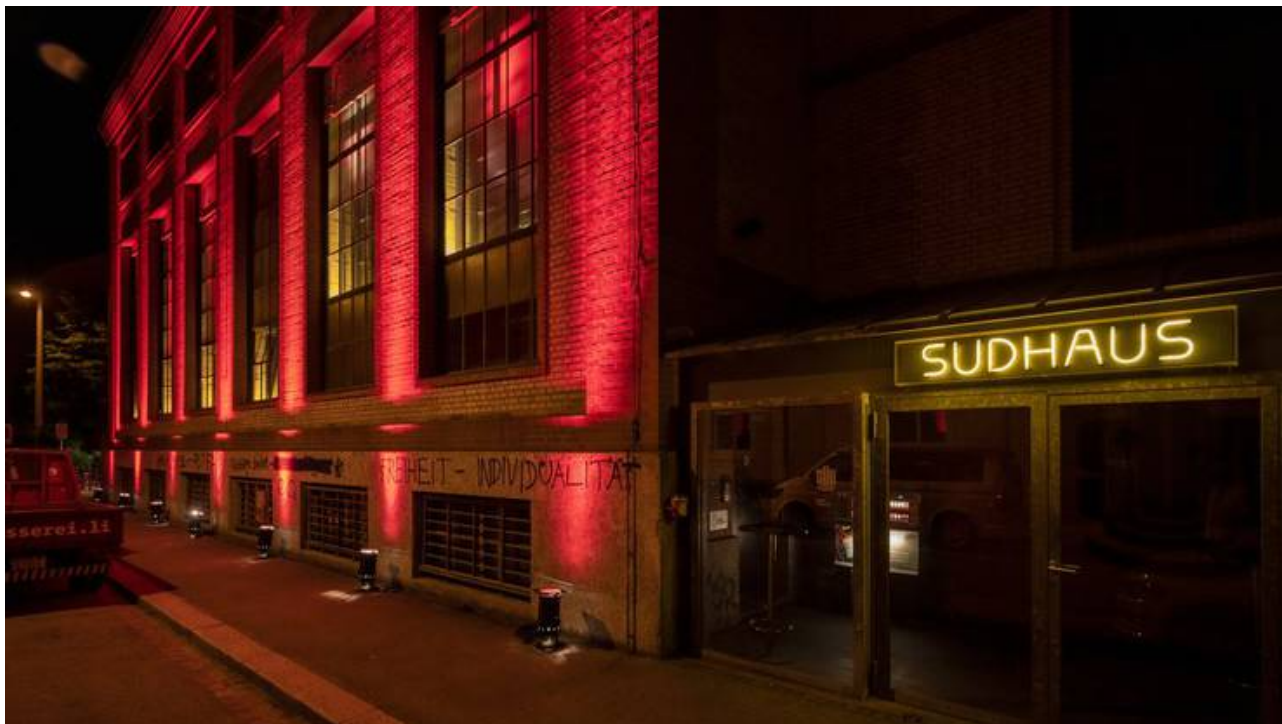
Auch das Sudhaus war Teil der Lichteraktion.facebooktwittermailprintwhatsappshare