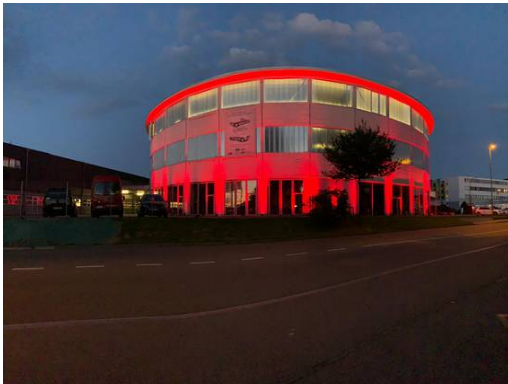
Das Pantheon in Muttenz.