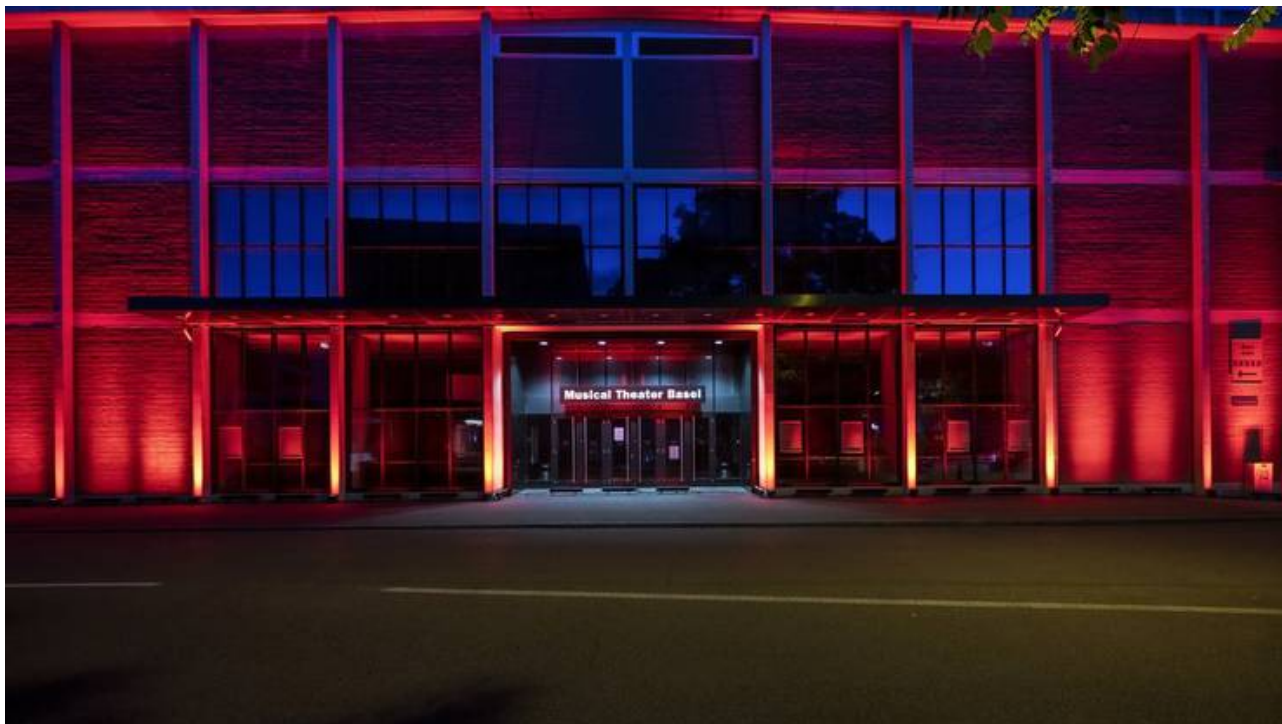
Das Musical Theater leuchtete ebenfalls Rot.facebooktwittermailprintwhatsappshare