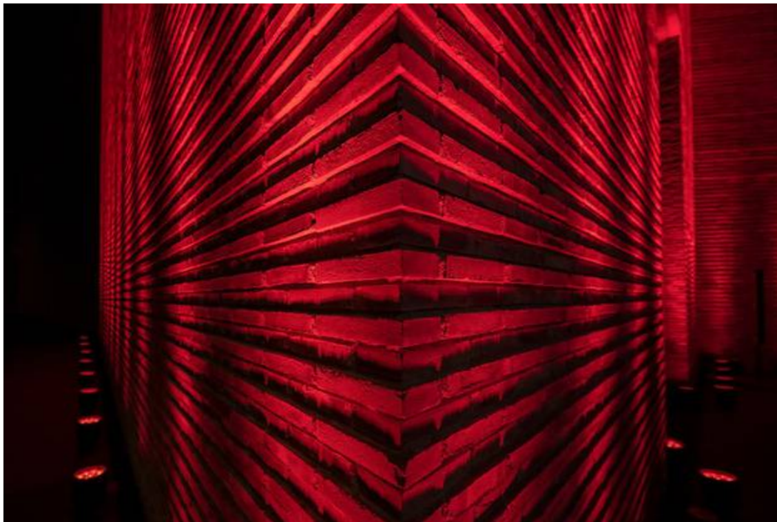
Auch das Kunstmuseum machte bei der Aktion mit. facebook twitter mail print whatsapp share