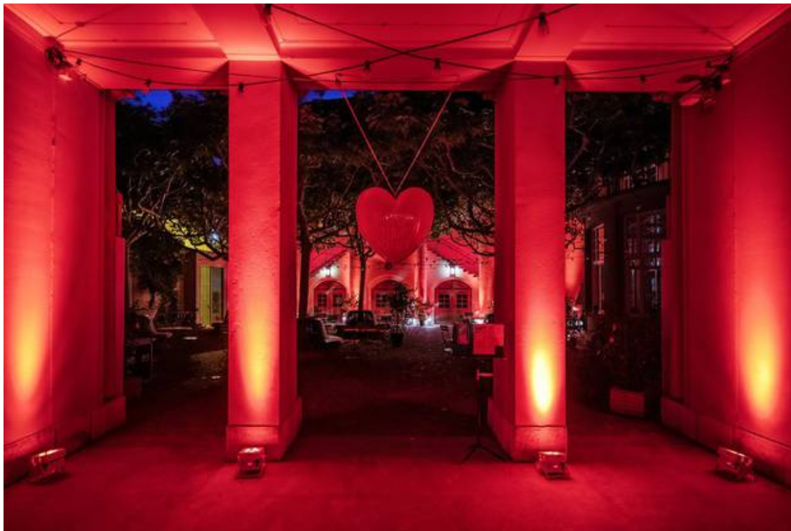
Das Volkshaus beteiligte sich ebenfalls.facebooktwittermailprintwhatsappshare