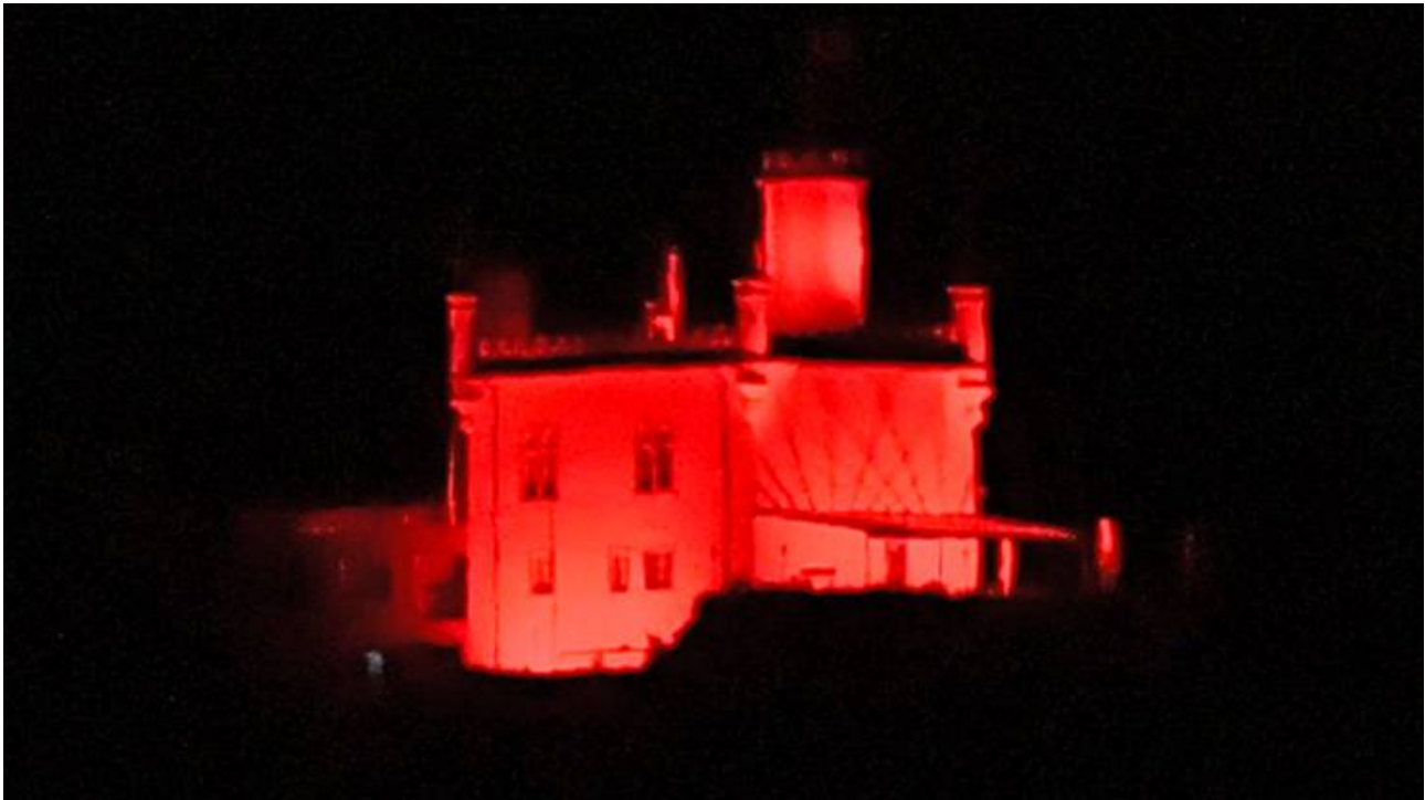
Das Sälischlössli während der Night of Lightfacebooktwittermailprintwhatsappshare