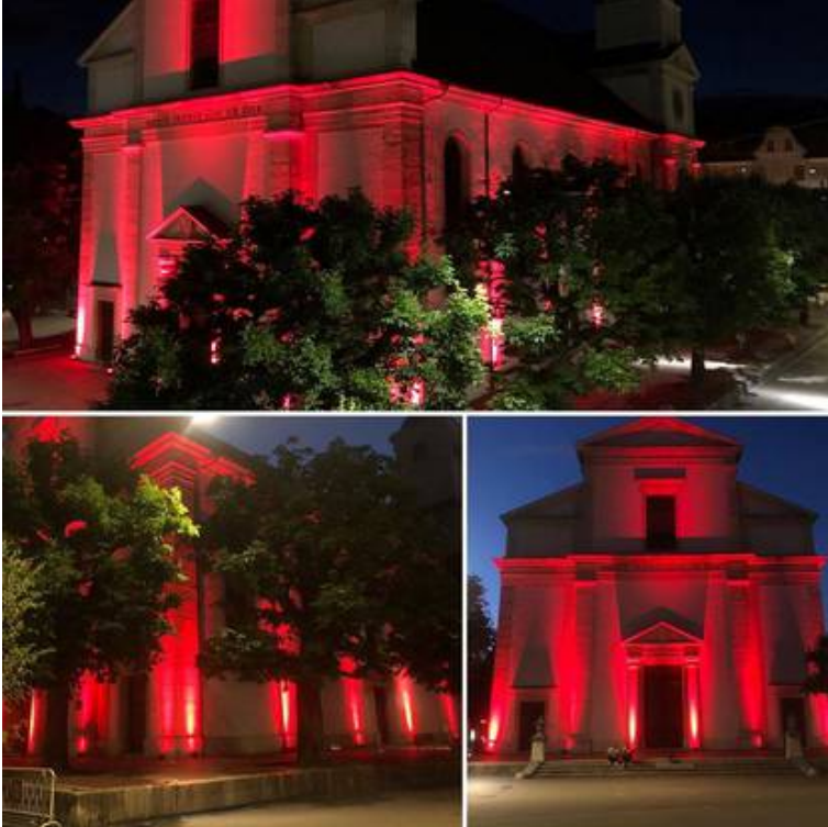
Stadtkirche Olten facebook twitter mail print whatsapp share

Referenz: 77585241 Ausschnitt Seite: 7/7