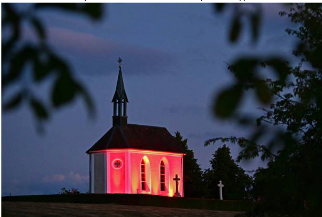
Auch die Bornkapelle ob Kappel ist rot beleuchtetfacebooktwittermailprintwhatsappshare