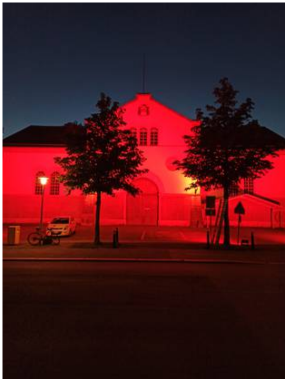
Reithalle Solothurnfacebooktwittermailprintwhatsappshare