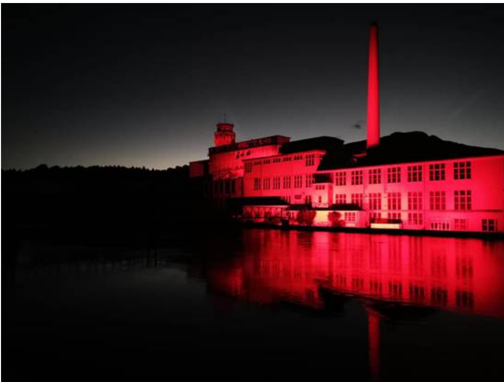
Attisholz Nord © Facebook/jumptvfacebooktwittermailprintwhatsappshare