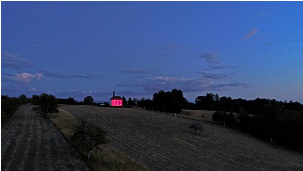
Von weiter her ist die Bornkapelle als kleiner roter und leuchtender Punkt zu sehen.facebooktwittermailprintwhatsappshare