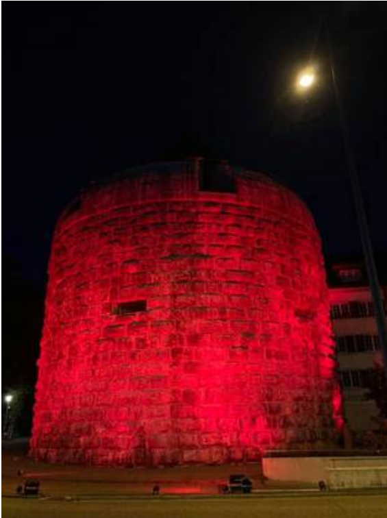
Der Muttiturm in Solothurn