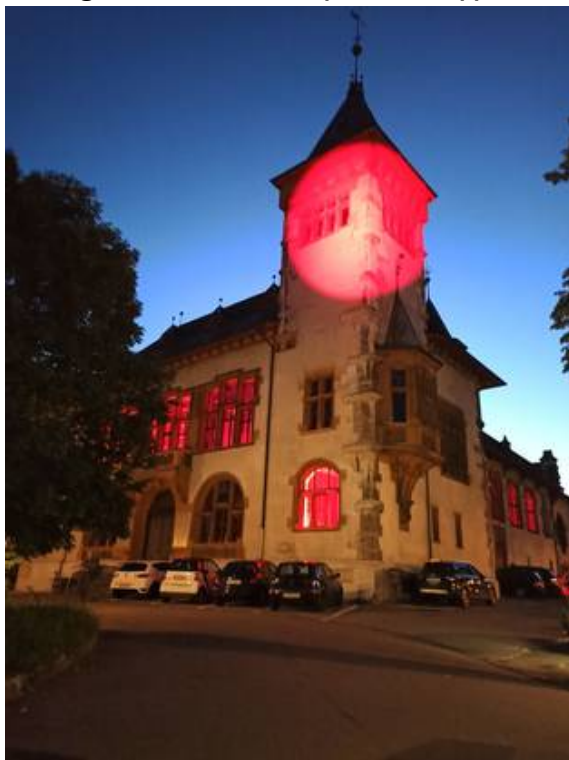
Konzertsaal Solothurnfacebooktwittermailprintwhatsappshare