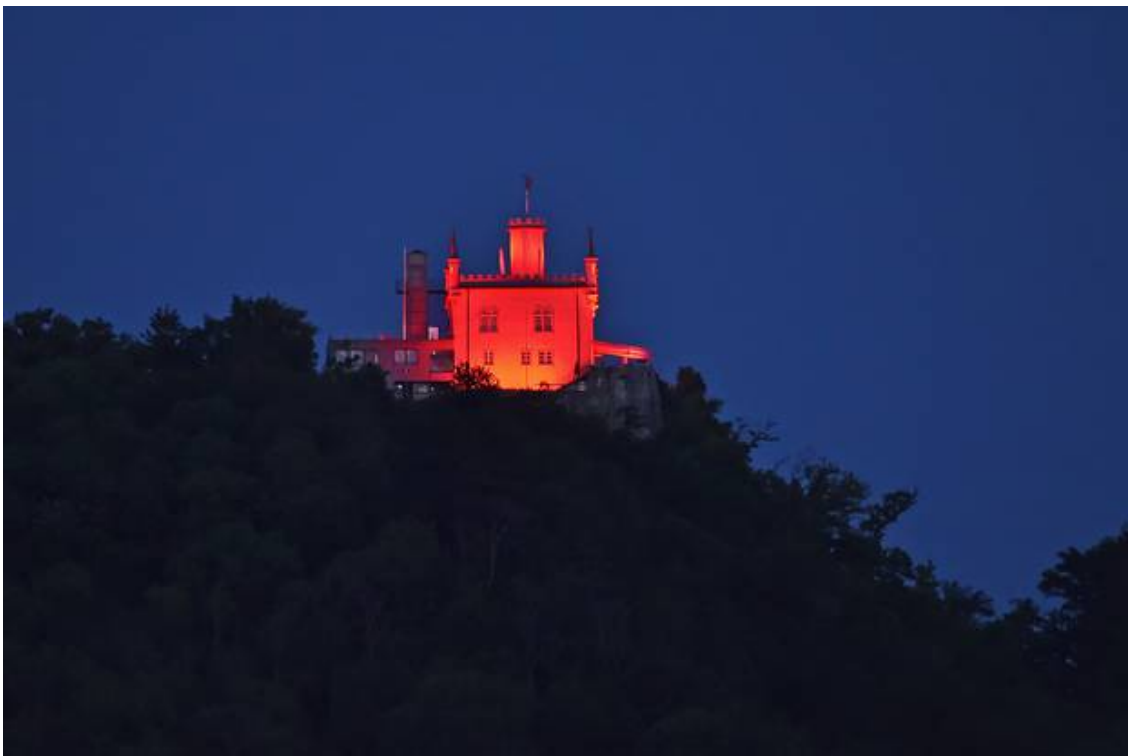
Weit oben leuchtet das Schlösslifacebooktwittermailprintwhatsappshare