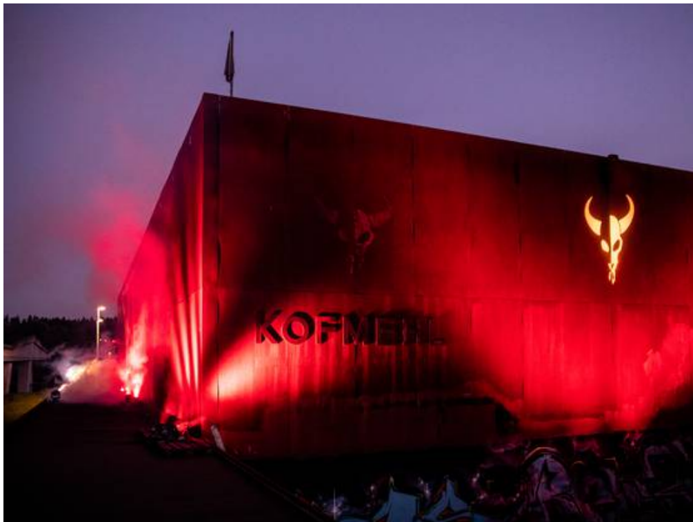
Die Kulturfabrik Kofmehl in Solothurn facebook twitter mail print whatsapp share