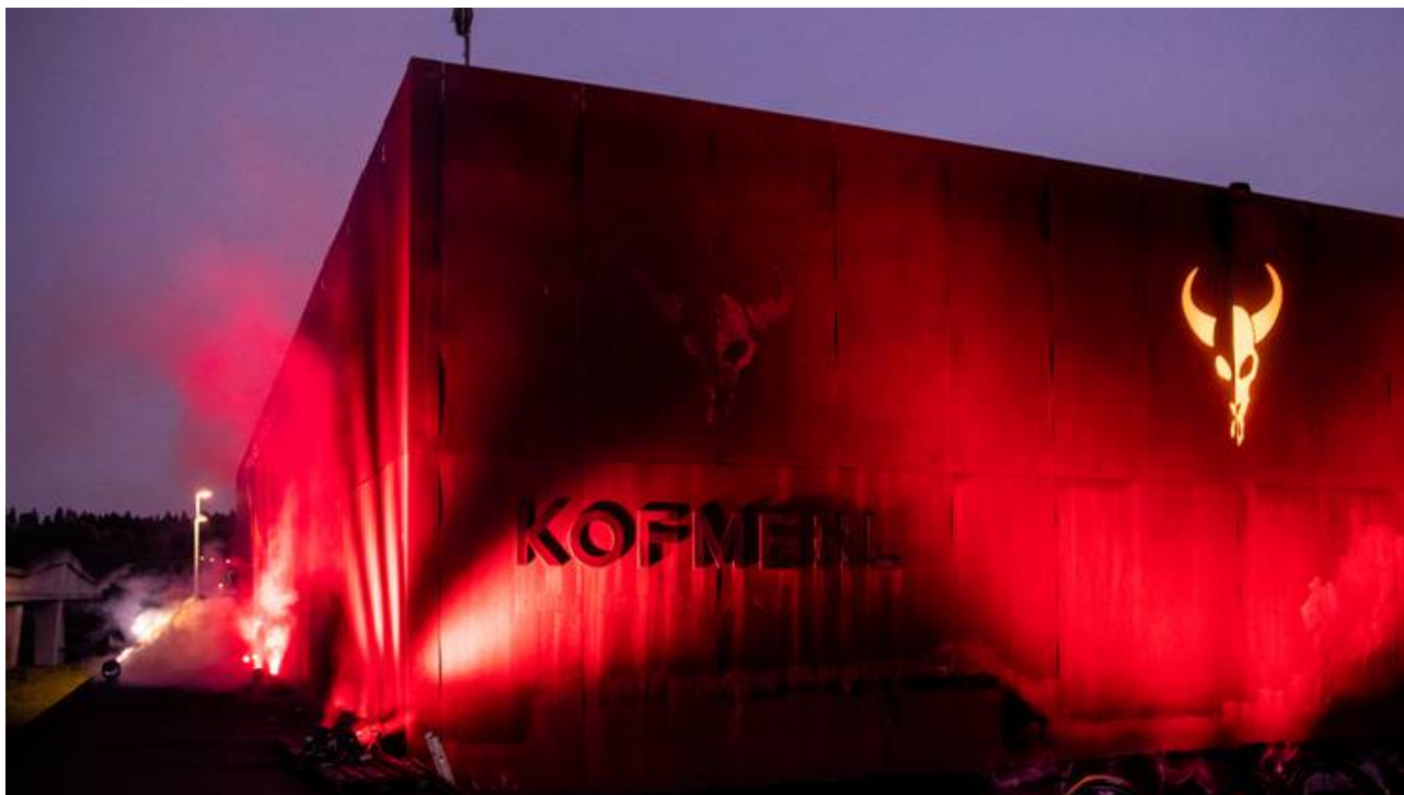
Im Rahmen der Aktion "Night of Light" wurden in der Stadt Solothurn mehrere Gebäude rot beleuchtet. Die Kulturfabrik Kofmehl facebook twitter mail print whatsapp share

Weitere Informationen zu der Aktion «Night of Light», der Forderung der Branche oder genauen Zahlen dazu finden sie unter: www.nightoflight.ch