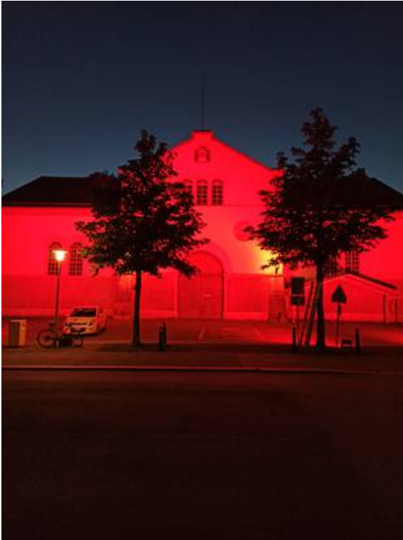
Die Reithallefacebooktwittermailprintwhatsappshare