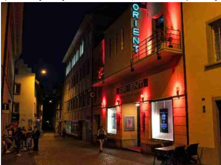
Der «Orient» in Rot – und die Gäste draussen genossen die Stimmung.