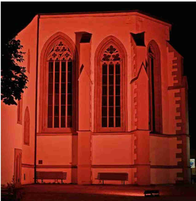
Auch vor der Kirche St. Johann standen rote Scheinwerfer.