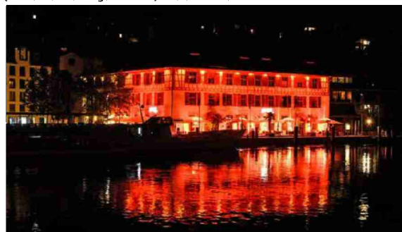
Ein Bild zum Festhalten: Der Güterhof «betrachtet» sich im nächtlichen Rhein.