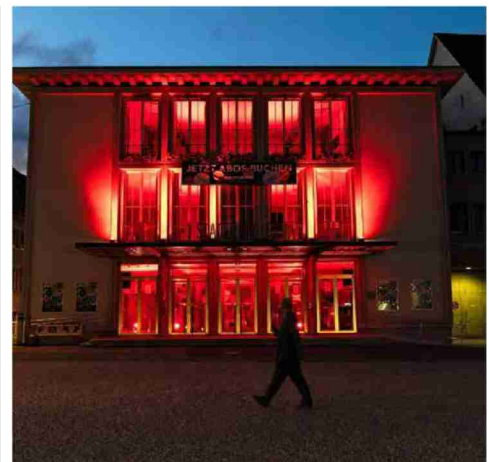
Das Stadttheater leuchtet weithin über den stillen Herrenacker.