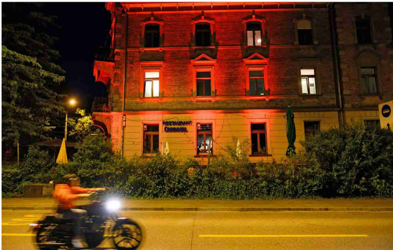
Spezielle Stimmung herrschte gestern Abend rund ums «Cardinal», das wie rund 20 andere Objekte in der Region (und schweizweit insgesamt 1100) in rotem Licht erstrahlte.

Referenz: 77593641 Ausschnitt Seite: 2/3