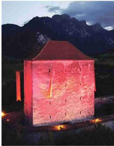
Die Strättliburg in Gwatt wurde von Rampenlicht Veranstaltungstechnik in rotes Licht gehüllt.

Auftrag: 3013103 Referenz: 77595386 Themen-Nr.: 800.020 Ausschnitt Seite: 4/4