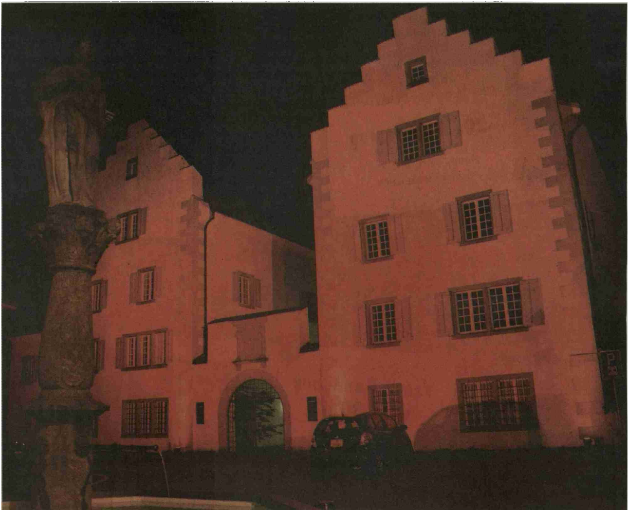
Das Fremdenspital, das Rathaus und das Theater Uri machten für 2 Stunden mit roter Beleuchtung auf sich aufmerksam.