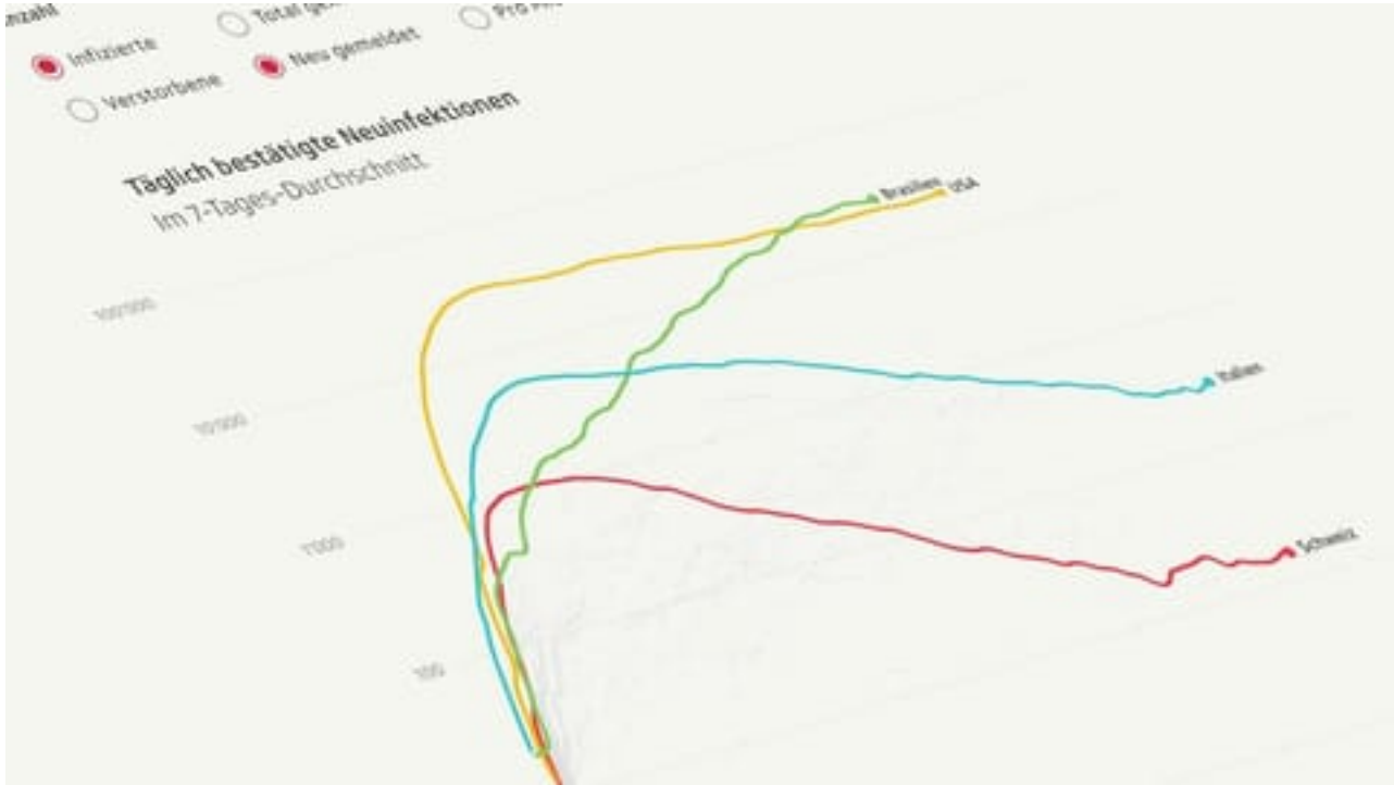
Coronavirus So entwickeln sich die Fallzahlen weltweit

Welche Regionen sind wie betroffen? Wo steigt die Kurve? Vergleichen Sie die Länder in unseren interaktiven Grafiken.