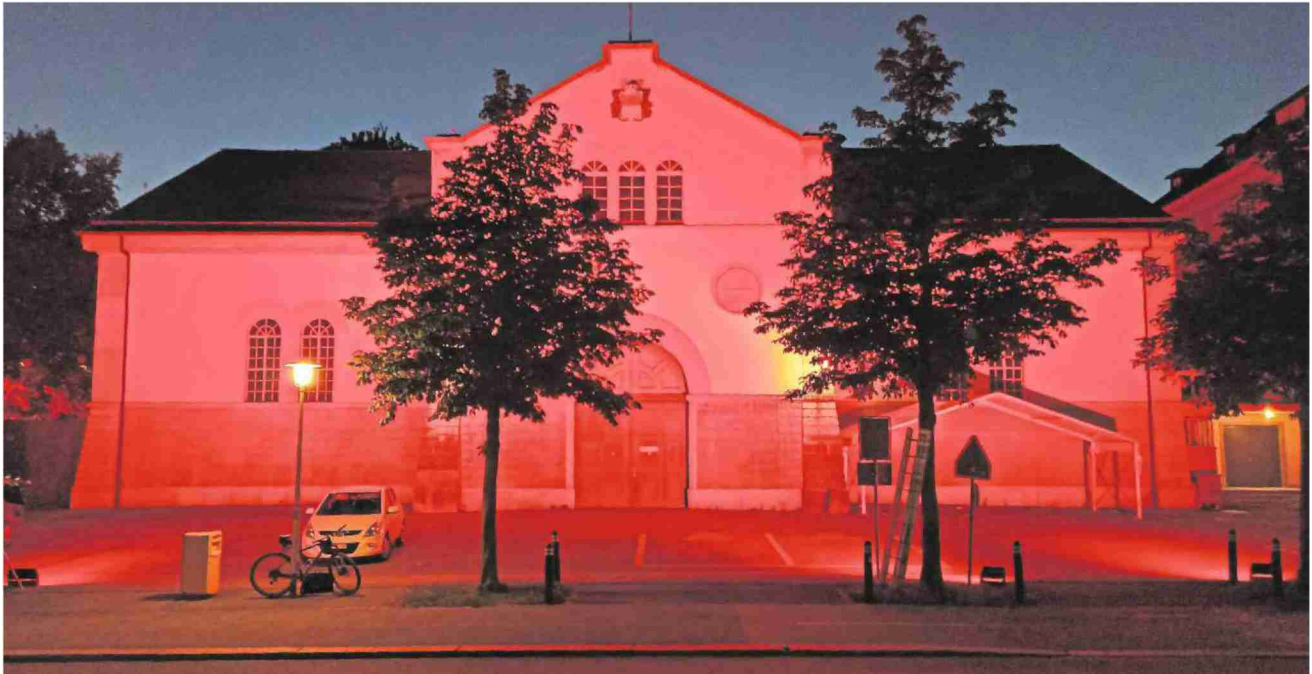
Im Rahmen der Aktion «Night of Light» wurden in der Stadt Solothurn mehrere Gebäude rot beleuchtet – unter anderem die Reithalle.