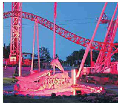
Das Conny-Land in Lipperswil.

Vorrat» produziert werden; die meisten Unternehmen in der Branche sind Dienstleister. Beleuchtet wurden unter anderem das Bettenhochhaus und der Gewerbepark Morgenstern in Frauenfeld sowie das Conny-Land.