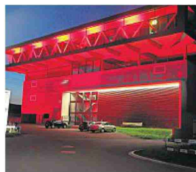
Der Gewerbepark Morgenstern.