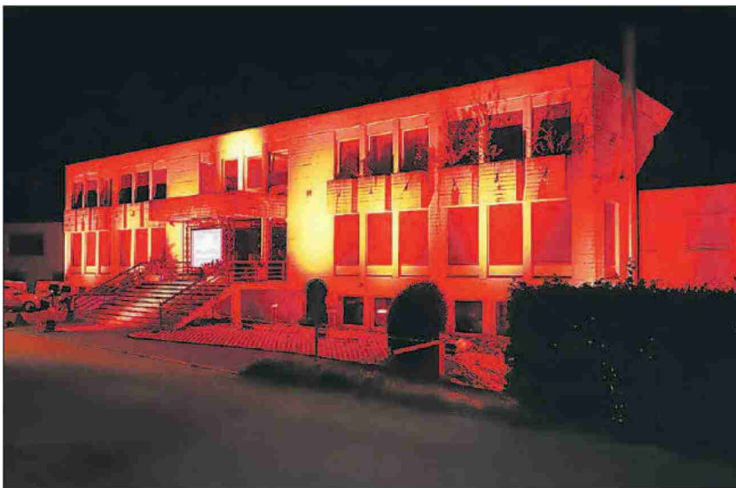
Aesch. Die Meili AG und die Light & Music Rent GmbH sind unter einem Dach zu Hause.

Zwar dürfen seit Anfang dieser Woche Veranstaltungen mit bis zu 1000 Teilnehmern stattfinden, doch bringt diese Lockerung den Organisatoren und Veranstaltern von Anlässen kaum eine Erleichterung. Im Gegenteil, es herrscht Alarmstufe Rot: Eine ganze Branche fühlt sich im Stich gelassen.