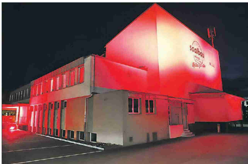
Reinach. Alarmstufe Rot auch beim Saalbau Reinach, der nächste Woche sein neues Programm vorstellen will.