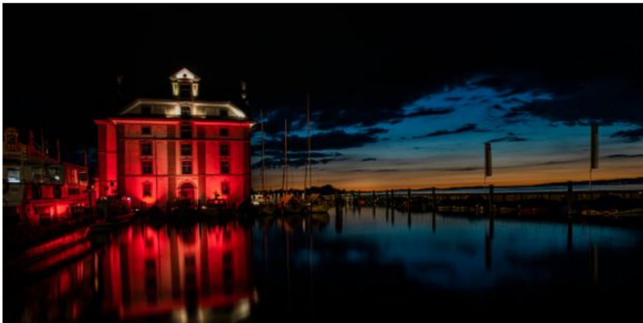
Das Rorschacher Kornhaus leuchtete vergangene Montagnacht rot. Die Event- und Kulturbranche will damit auf die dramatische Lage aufmerksam machen. Terra Media

Die Idee zu dieser Aktion hat die Schweizer Branche von ihren Kolleginnen und Kollegen aus Deutschland übernommen. Denn die aktuelle Situation habe durchaus internationales, wenn nicht globales Ausmass, heisst es in der Medienmitteilung weiter.