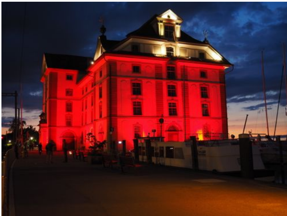
Das Rorschacher Kornhaus leuchtete vergangene Montagnacht rot. Die Event- und Kulturlandschaft will damit auf