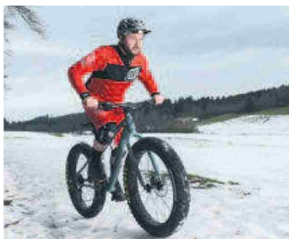
Les amateurs de fatbike pourront rouler sur neige entre Bretaye et Villars.