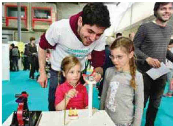
COMPRENDRE Toute l'équipe de Scientastic – composée de chercheurs, d'étudiants et de médiateurs de l'EPFL – a été très engagée durant le festival.