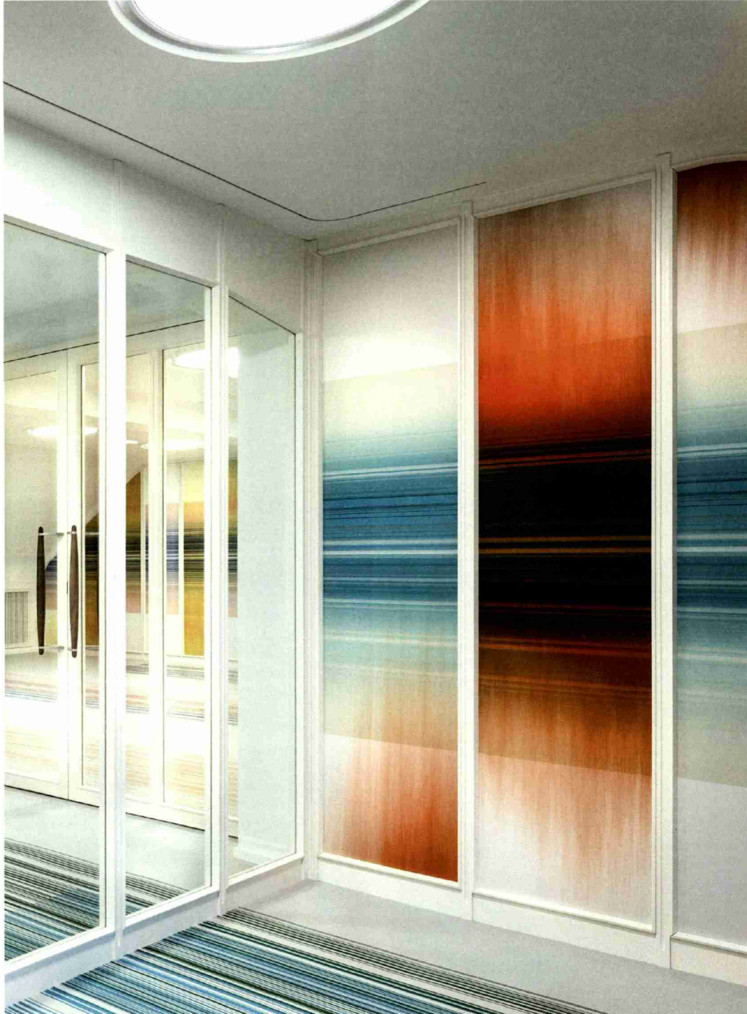
«The Colour Rooms» von Lela Scherrer und Christoph Hefti: Der Farbverlauf symbolisiert das Handwerkliche des Siebdrucks, die präzisen horizontalen Streifen stehen für die Kontinuität des Digitalprints.

Referenz: 67728558 Ausschnitt Seite: 4/4