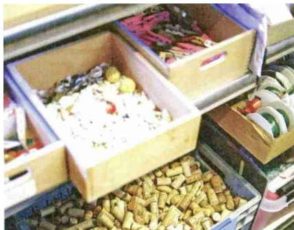
Chez OFFCUT , pas de déchets. On valorise au lieu de jeter.