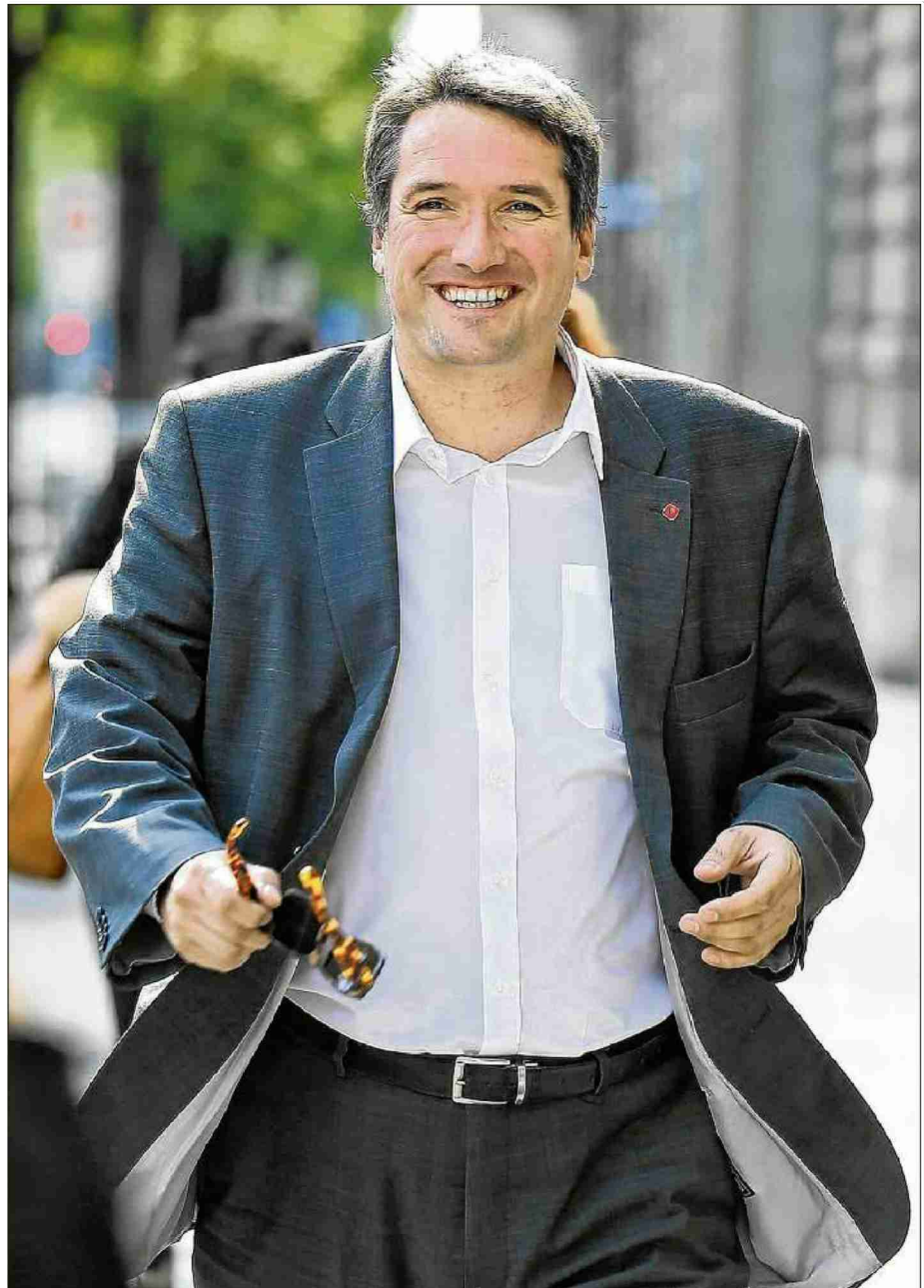
Beau 1 er rang, mais Christian Levrat n'estime pas l'élection du 18 octobre gagnée d'avance.

tion qui règne à Berne. le Fribourgeois lance comme une mise en garde à l'attention de l'ensemble des candidats du 18 octobre. Deux paramètres sont selon lui rédhibitoires: la maîtrise de l'allemand et la capacité de s'affirmer dans au moins un dossier. «Les trois quarts des sièges du parlement sont occupés par des Alémaniques», éclaire-t-il. «J'observe que tous ceux qui sont bien classés sont plus ou moins bilingues, comme F. Lombardi (dc/TI) 2 e , P. Bischof (dc/SO) 3 e , M. Bäumle (pvl/ZH) 4 e et A. Tschumperlin (ps/SZ) 5 e .» I